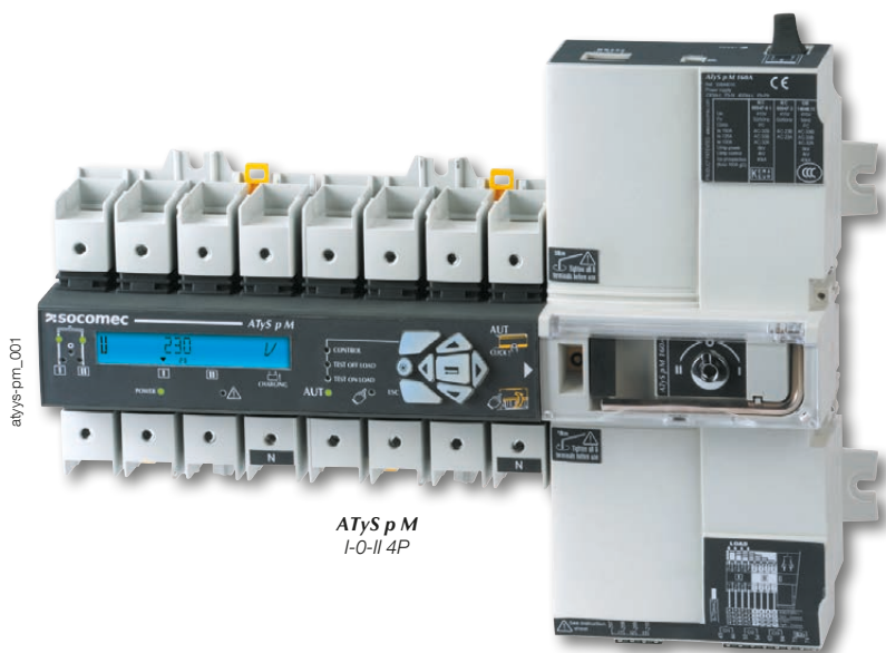
ATyS p M I-O-II 4P