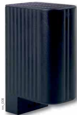
Convection naturelle Classe II