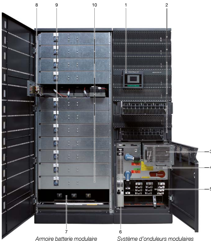
Armoire batterie modulaire