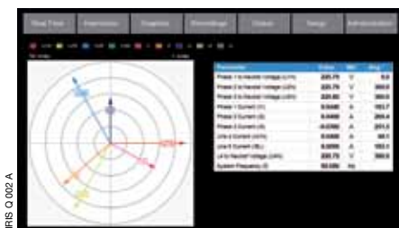
DIRIS Q 002 A