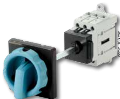
COMO Commande extérieure