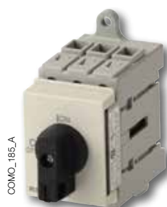
COMO Commande directe