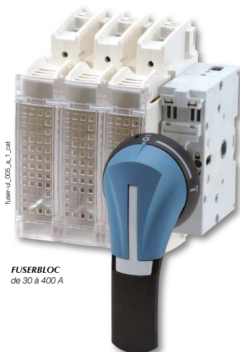
FUSERBLOC de 30 à 400 A