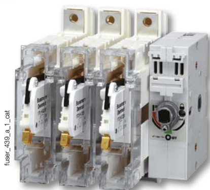
FUSERBLOC de 25 à 400 A