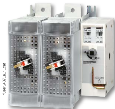
FUSERBLOC de 630 à 1250 A

protection des semi-conducteurs de puissance jusqu'à 1250 A