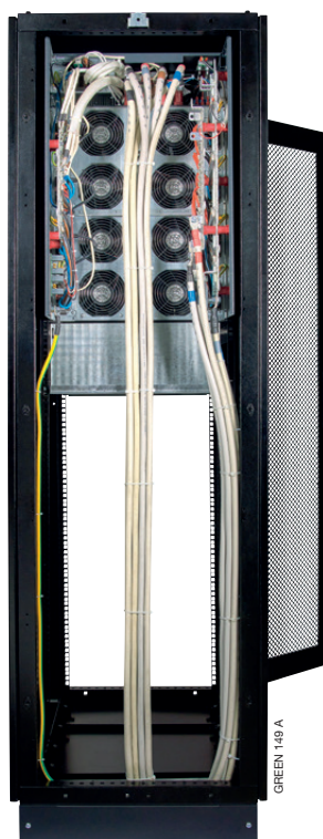
Vue arrière (avant ajout du cache de protection) Câblage adaptable, pour faciliter les raccordements et aligner les câbles.