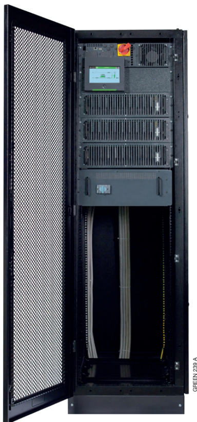
Exemple d'intégration (3 x 25 kW). Uniquement 15 U occupés : conception compacte, laissant un maximum d'espace disponible pour d'autres équipements montés en rack. Un slot vide dans le sub-rack MODULYS RM GP reste disponible pour l'augmentation de la puissance ou de la redondance.