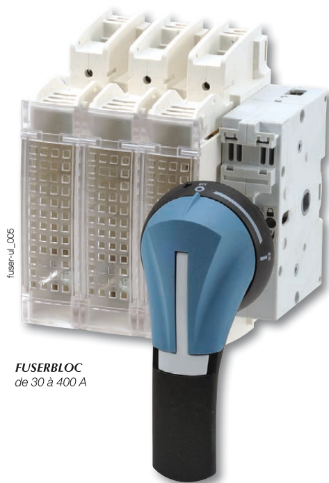
FUSERBLOC de 30 à 400 A